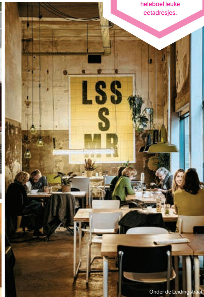
Onder de Leidingstraat

De hippe wijk Strijp-S wordt ook weleens 'de verboden stad' genoemd omdat de site vroeger enkel toegankelijk was voor werknemers van Philips. Vandaag heeft het nog steeds die industriële, beetje New Yorkse vibe. Je vindt er coole ateliers en shops van jonge ondernemers en een heleboel leuke eetadresjes.