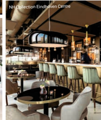
NH Collection Eindhoven Centre